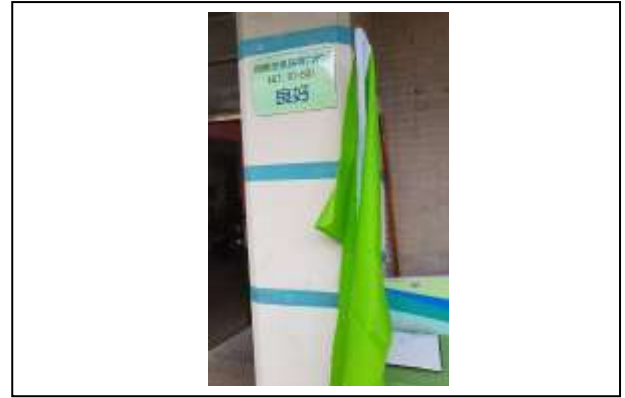
說明:以顏色旗幟向師生提示當日空氣品質狀況