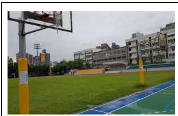
說明:在運動場張貼垃圾不落地公告向民眾宣導愛護環境