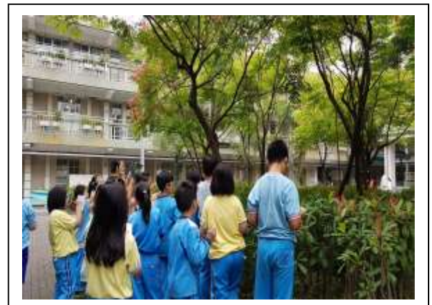
說明:教師適時帶領學生以校園植物為題材融入領域教學課程