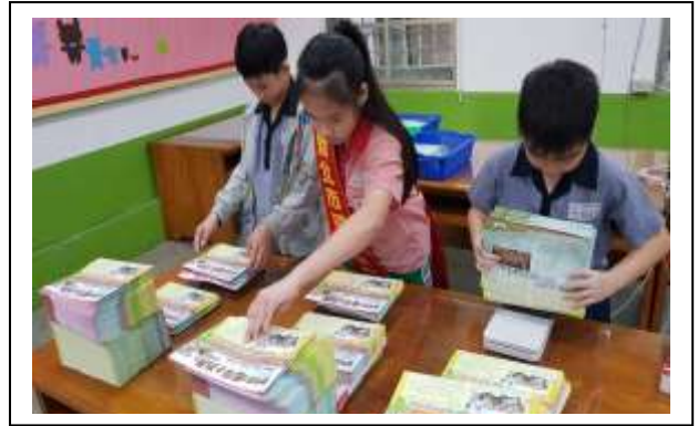
說明:本年度定期發放新北市環保小局長雙月刊刊物