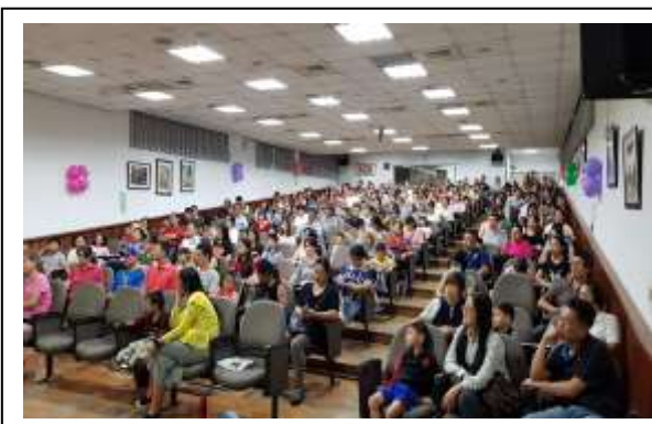
說明:邀請專家在學校日向家長宣導視力保健講座