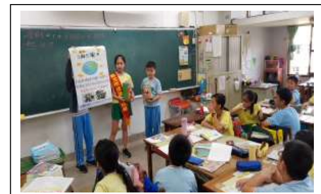
說明:自治市長及環保小局長入班宣導廢電池回收活動