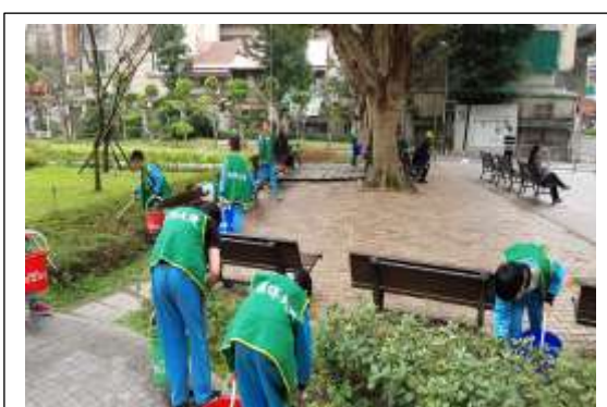
說明:107/1/1~12/31 校內環保大使同學清理校園周邊整潔環境