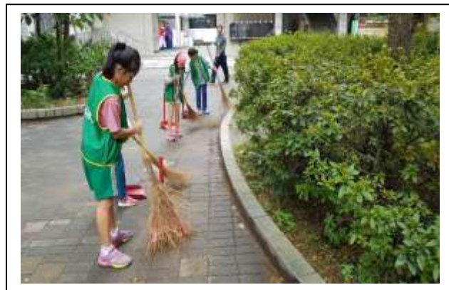
說明:學生定時清理維護生態池及校園整潔