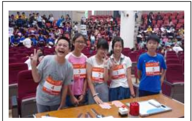
說明:107/5/9 參加健康小學堂雙和區競賽初賽