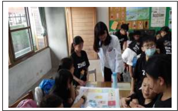
說明:107/4/20 雙和醫院<正確用藥>入班宣導