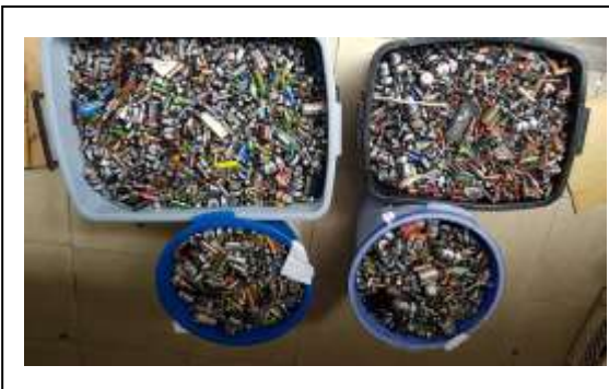
說明:107/11/1~11/30 推廣廢電池回收競賽活動(共 1100 餘公斤)