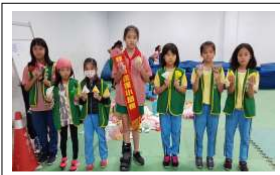
說明:107/1/1~12/31 推廣家庭塑膠袋回收再利用活動