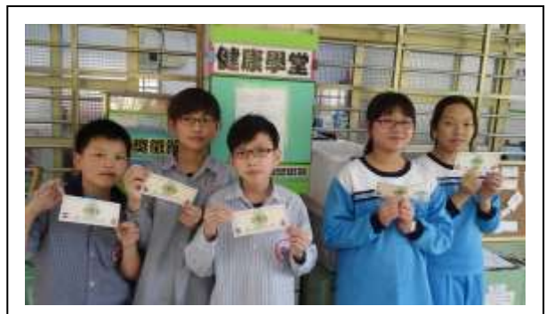
說明:107/1/1~12/31 定期舉辦環保/健康小學堂有獎徵答摸獎活動