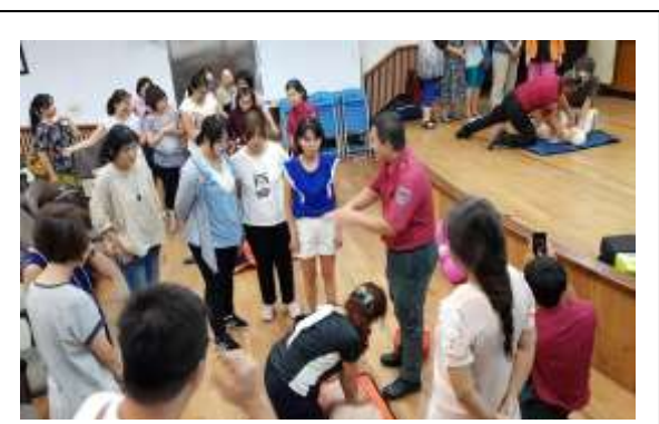
說明:邀請消防分隊講師向教師進行CPR及AED教學研習