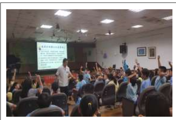
說明:辦理安全用藥講座，向學生宣導正確用藥知識