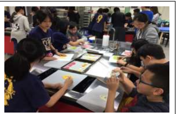
說明:107/10/12 青鱈魚推廣校際活動