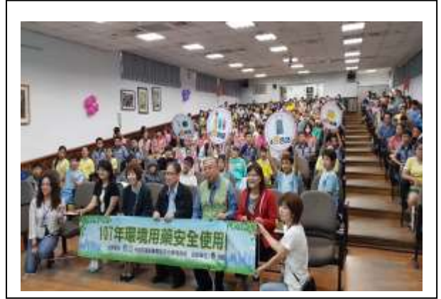
說明:107/11/19 辦理高年級環境用藥安全宣導講座