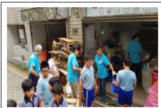
說明:107/1/1~12/31 環境志工熱心服務本校資源回收工作