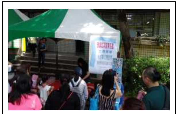
說明:107/5/5 園遊會設置環境教育宣導攤位